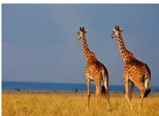
Maasai Mara 📍