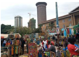
Maasai Mara 📍 🚗 - 🕒 6h Nairobi 📍