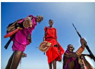
Parc National Amboseli 📍