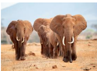
Parc National Amboseli 📍