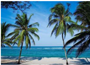
Shimba Hills 📍