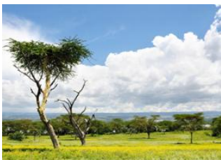
Lac Nakuru 📍