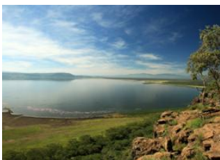
Maasai Mara 📍