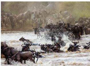
Maasai Mara 📍